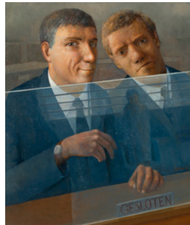
JOHN GOUDIE LYNCH (*1946)

Σε αντίθεση με τα δύο προηγούμενα έργα, το μικρό σχέδιο της Galli είναι μια ελαφριά και ξέγνοιαστη αφιέρωση στο γραφείο κοινωνικής ασφάλισης ή συνταξιοδότησης.