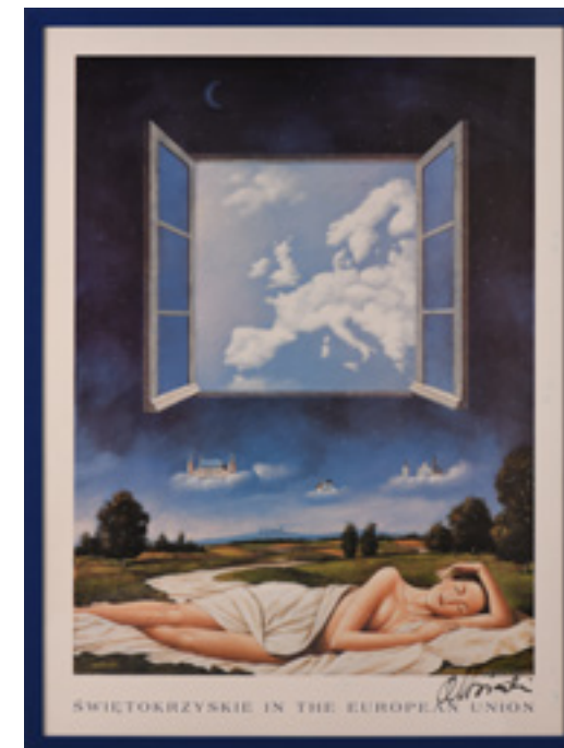
RAFAL OLBINSKI (*1945)

Το έργο των Missirkov/Bogdanov προσφέρει μια πιθανή εκδοχή του τρόπου με τον οποίο το Buzludzha θα μπορούσε να αξιοποιηθεί στο μέλλον μετά από πολλές γενιές». 21