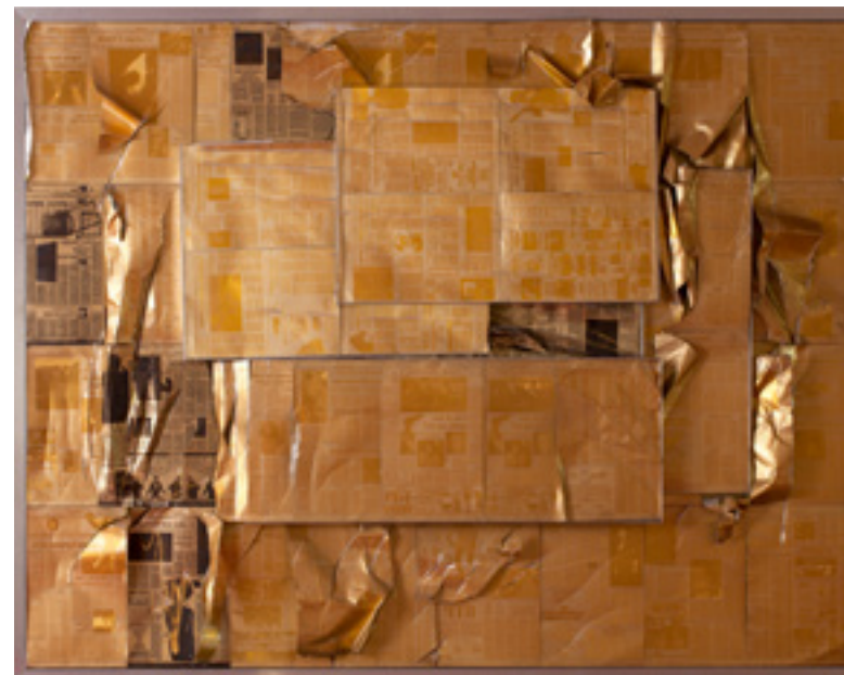
OLAF METZEL (*1952)

Αν και το γλυπτό είναι πολύ πιο αφηρημένο από την πρωτότυπη φωτογραφία και δεν απεικονίζει λεπτομερώς τα πρόσωπα των ατόμων, η Baumgart δίνει στο έργο ένα αξιοσημείωτο ρεαλισμό στην αναδημιουργία των αντικειμένων που μεταφέρουν, και στην υφή των κουτιών. Το αίσθημα του επειγόντος και του φόβου, το οποίο καταδεικνύεται από τις θέσεις και τις χειρονομίες των πολιτών του Βερολίνου στη φωτογραφία, αμβλύνεται στα γλυπτά από ρητίνη, ένα υλικό που χρησιμοποιείται ευρέως από σύγχρονα ονόματα της εικονιστικής γλυπτικής, όπως ο Juan Muñoz ή ο Keith Edmier.