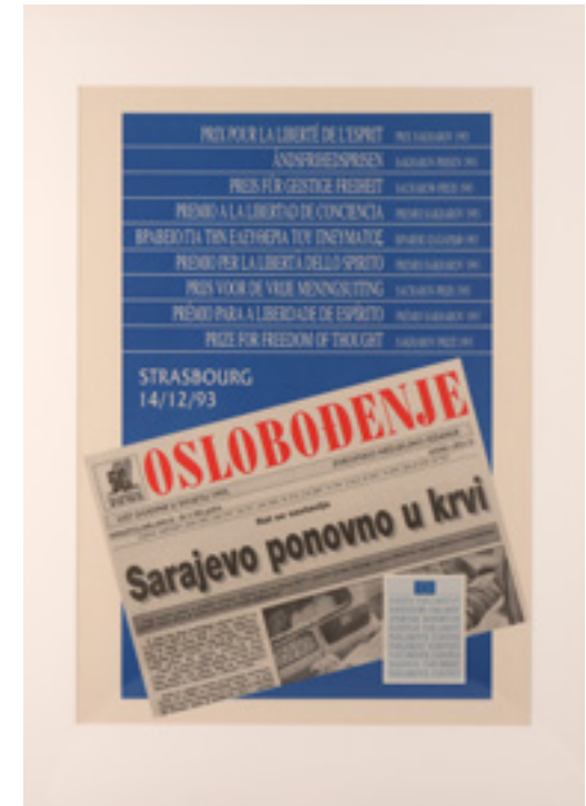
ΑΦΙΣΑ ΤΟΥ ΒΡΑΒΕΙΟΥ ΖΑΧΑΡΩΦ ΓΙΑ ΤΗΝ ΕΛΕΥΘΕΡΙΑ ΤΟΥ ΠΝΕΥΜΑΤΟΣ (1993)

Από την άλλη πλευρά, η υδροκομμογραφία Wähle! (Επιλογή) (1979), του Jörg Immendorff , ενός ζωγράφου που αντιλαμβάνεται την τέχνη ως επανόρθωση των κοινωνικών και πολιτικών διαφορών, δημιουργήθηκε την εποχή που παρήγαγε την πιο διάσημη εικονογραφική σειρά του, Cafe Deutschland (1977-1982) 12 . Αυτό το μικρό έργο σε χαρτί - Wähle! - είναι μια έντονη προτροπή για ελεύθερη έκφραση και επιλογή μεταξύ διαφόρων εναλλακτικών λύσεων, επισημαίνοντας έτσι την ενεργό συμμετοχή σε θέματα που αφορούν τη ζωή των πολιτών.