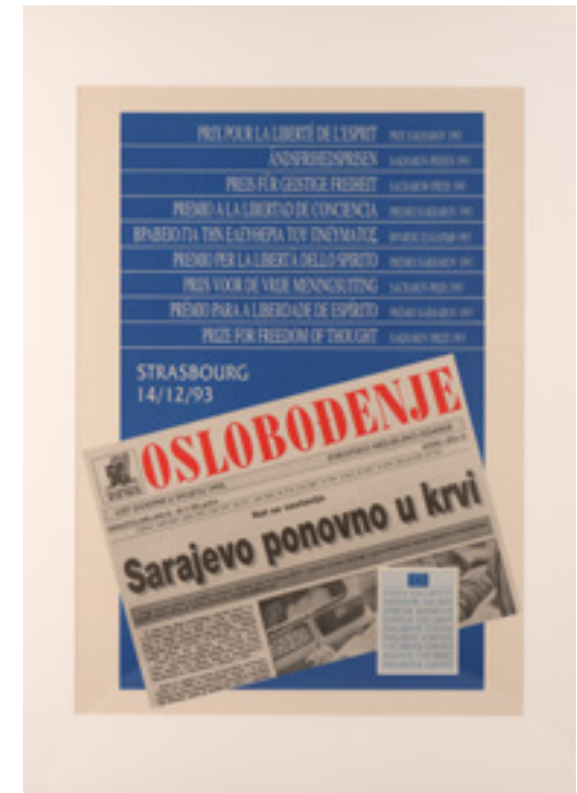
SAHHAROVI MÕTTEVABADUSE AUHINNA PLAKAT (1993)

Maalikunstnik Jörg Immendorff nägi kunstis sotsiaalsete ja poliitiliste murede leevendajat. Guašš „ Wähle! “ (1979) pärineb ajast, mil kunstnikul valmis tema kuulsaim pildisari „Cafe Deutschland“ (1977–1982) 12 . See väike maal paberil – „Wähle!“ – on kirglik üleskutse vabalt sõna võtta ja valida erinevate alternatiivide vahel, osutades seega aktiivsele osalemisele ühiskonnaelus.