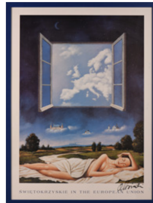
RAFAL OLBINSKI (SÜND. 1945)