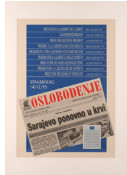
PÓSTAER DE DHU AIS SAKHAROV UM SHAOIRSE SMAOINTEOIREACHTA(1993)

Ar an láimh eile, an Wähle gouache! (1979), - le Jörg Immendorff - péintéir a thuig an ealaín mar ábhar ceartúcháin ar ghearáin shóisialta agus pholaitiúla - san am nuair a léirigh sé a shraith pictiúr is cáiliúla, Cafe Deutschland (1977-1982) 12 -. An obair bheag seo ar pháipéar - Wähle! - is spreagadh paiseanta é labhairt amach gan srian agus rogha a dhéanamh idir roghanna éagsúla, rud a thabharfadh le fios rannpháirtíocht ghníomhach i gcúrsaí a bhaineann leis an saol sibhialta.