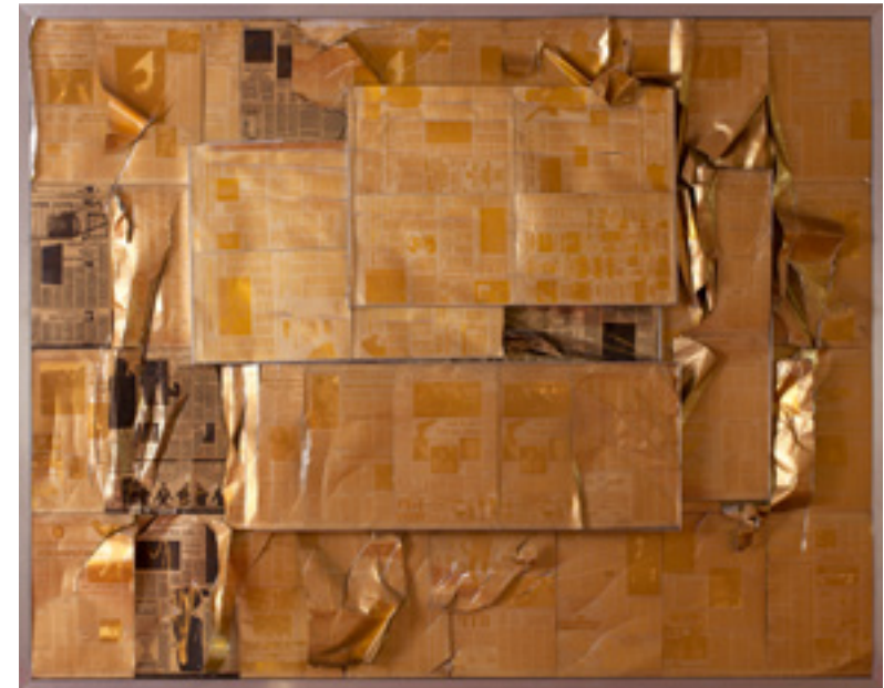
OLAF METZEL (*1952)

Għalkemm l-iskultura hija ferm iktar astratta mir-ritratt originali u ma turix l-uċuħ tal-individwi fid-dettall, Baumgart tagħti laqta' realista ħafna lil dan ix-xogħol artistiku billi toħloq mill-gdid l-oġġetti li qed iġorru, inkluż it-texture tal-kaxxi u l-basktijiet. Is-sentiment ta' urġenza u biża', li joħroġ mill-pożizzjonijiet u l-mossi taċ-ċittadini ta' Berlin fir-ritratt, trattab daqsxejn fil-figuri tar-reżina, li huwa materjal użat spiss minn artisti kontemporanji impattanti li jipproduċu skulturi figurattivi, bħal Juan Muñoz jew Keith Edmier.