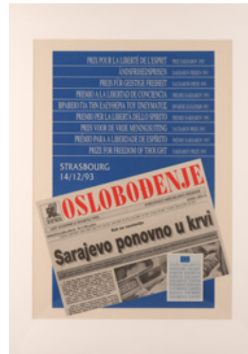
POSTER TAL-PREMJU SAKHAROV GĦAL-LIBERTÀ TAL-ĦSIEB (1993)

Min-naħa l-oħra, il-gouache Wähle! (1979) , - ta' Jörg Immendorff - pittur li kien jifhem l-arti bħala rimedju għat-tigrib soċjali u politiku - huwa parti minn żmien meta pproduċa s-sensiela ta' pitturi l-aktar famużi tiegħu, Cafe Deutschland (1977-1982) 12 - . Dan ix-xogħol ċkejken fuq il-karta - Wähle! - huwa sejha mqanqla biex in-nies jikkellmu b'mod liberu u jagħżlu bejn diversi alternattivi, u b'hekk jiġbed l-attenzjoni għal parteċipazzjoni attiva fi kwistjonijiet li jikkonċernaw il-ħajja ċivika.