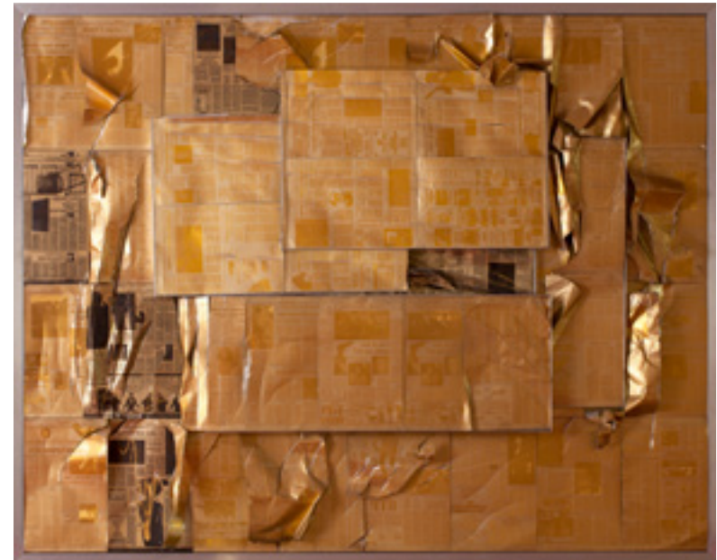
OLAF METZEL (*1952)