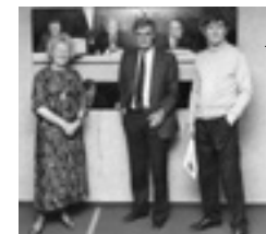
Fotografija, ki jo je poslal J. G. Lynch: predstavitev slike v Evropskem parlamentu, ok. 1987–1988

Delo Hémicycle Strasbourg (Sejna dvorana v Strasbourgu) (1987) prikazuje plenarno dvorano, ki je dom zakonodajne pristojnosti Evropske skupnosti, med zasedanjem, ki mu leta 1987 predseduje P. Daenkert. Verjetno je podlaga za to fotografija iz tega obdobja, ki jo je z dokumentarno natančnostjo in tehnično jasnostjo slikovno interpretiral John Goudie Lynch .