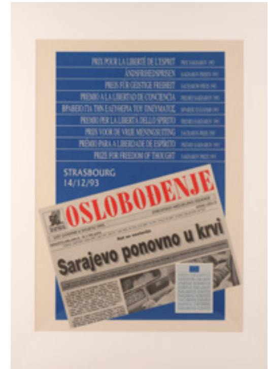
PLAKAT ZA NAGRADO SAHAROVA ZA SVOBODO MISLI (1993)

Po drugi strani pa je gvaš Wähle! (1979) slikarja Jörga Immendorffa, ki je umetnost razumel kot korektiv za socialne in politične krivice, nastal v času ustvarjanja umetnikove najslavnejše serije z naslovom Cafe Deutschland (1977–1982) 12 . To sicer majhno delo na papirju je strasten poziv k svobodnemu govoru in izbiri med različnimi možnostmi, s čimer spodbuja k dejavnemu sodelovanju v državljskem življenju.