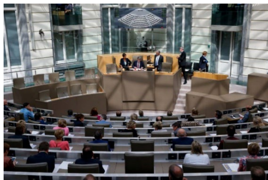
Белгия – Фламандският парламент