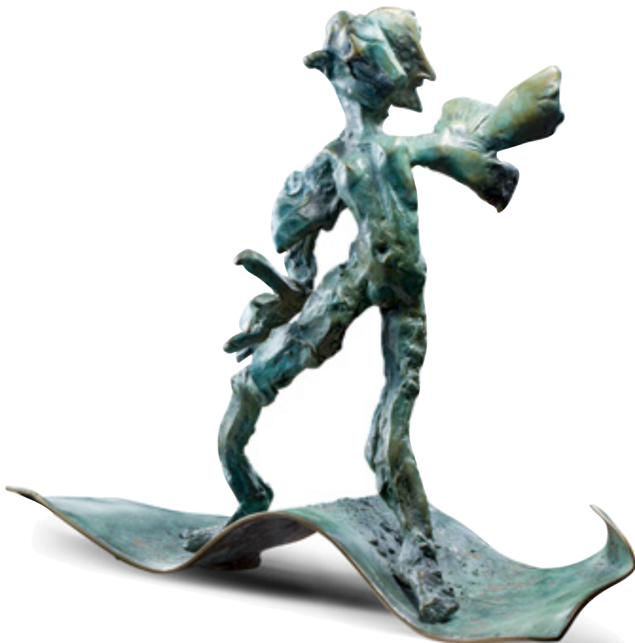
CATHY CARMAN Irlande MASQUERADE (1992) Bronze 45 cm