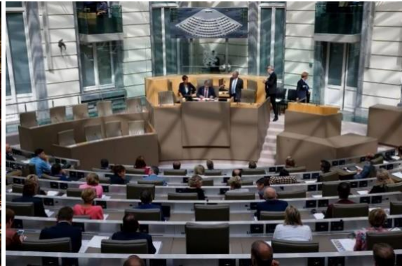
Vlaams parlement (België)