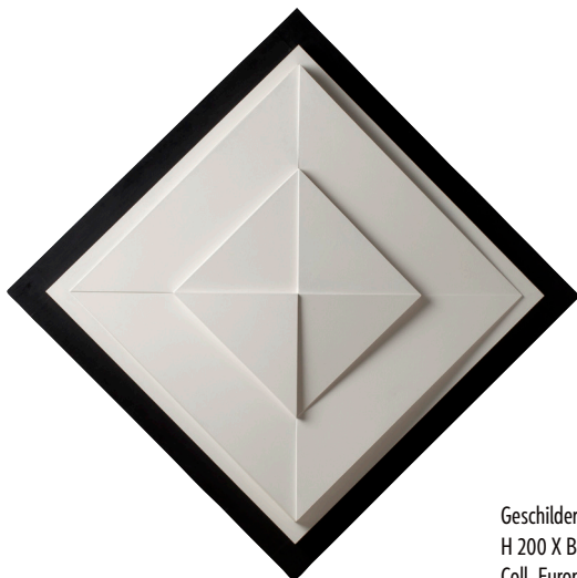
Geschilderd hout H 200 X B 200 cm Coll. Europees Parlement

A Quattro Voci (Met vier stemmen) , 1980