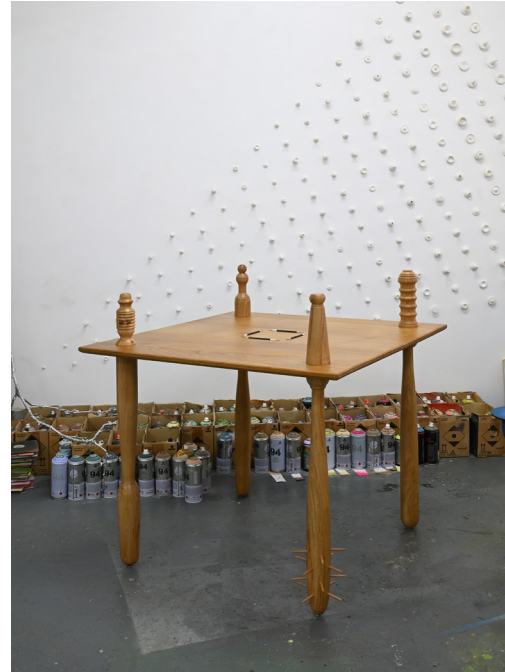
Eik, beuk, potloden H 92 X B 92 X D 90,5 cm Coll. kunstenaar

In Negotiation Table worden vier puntig geslepen potloden omringd door vier uitstekende, variërende tafelpoten in de hoeken van het tafelblad. De tafelpoten zijn allemaal verschillend. Door deze details lijkt het object bevrijd van de huiselijke functie en geeft ruimte aan de verbeelding. De tafelpoten kunnen dienen als een soort roer om degene die rond de tafel zitten op koers te houden, zeker wanneer er dingen onder tafel gebeuren. De tafelpoten kunnen als baken fungeren, wanneer de discussies oververhit raken.