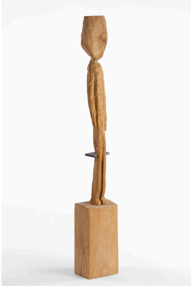
Hout en metaal H 80 x B 20 x D 20 cm Coll. Duitstalige Gemeenschap van België

De menselijke figuur staat op een blok hout met opgeheven hoofd. Het beeld is een metafoor voor Resilienz . Het blok hout symboliseert de uitdagingen van het leven. De metalen plaat in de knieholte staat voor een verwonding of een uitdaging die overwonnen moet worden en kans op groei. De sculptuur inspireert het vermogen om moeilijke tijden te overwinnen en er gesterkt of getransformeerd uit te komen. Op deze tentoonstelling is de toeschouwer vrij om associaties te maken met de kiezers, in België, in Europa, wereldwijd, die kwetsbaar kunnen zijn. Het kan verwijzen naar de politici, die door het