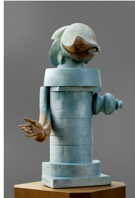
Geschilderd hout H 83 cm Coll. Europees Parlement

De figuur van De profeet is abstract en geassembleerd. Een grote mond, lippen, figuratieve arm en hand en een verticale totem vallen te onderscheiden. Het is niet geheel duidelijk waarvan of waarvoor deze verzameling profeet fungeert. In de context van de tentoonstelling kan men denken aan profetische voorspellingen van politici, journalisten, professoren over de komende verkiezingen. Een politicus of politica kan profetische kwaliteiten worden toegedicht. Op een "momentum" weet hij of zij een scherpe analyse te maken die precies de actuele tendensen weergeeft en kan zo meesurfen op de hoge golf en als een stemmencanon de verkiezingen winnen. De houdbaarheidsdatum als profetische pionier is verre van eeuwig. Menig gelauwerd politicus valt van een voetstuk, verwordt een schim van zichzelf of een roeper in de woestijn. Ook een kunstenaar kan als visionair of pionier worden gezien, door het capteren van