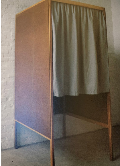
Mixed media H 200 x B 82 x D 108 cm Coll. Particuliere verzamelaar Vincent Vlasblom

Het stemhok in Composition trouvée is een vroege voorloper van het Stemhokkenmuseum . In Stemhokkenmuseum , vraagt Bijl zich af wat allemaal kunst kan of zou kunnen zijn. Hij stelt ook de drang van de kunstwereld om thematische tentoonstellingen te presenteren aan de kaak. Hij hekelt het museum als instituut en het artificiële van het presenteren van culturele objecten. Het ironische en bevragende museale discours van de kunstenaar nodigt iedere instelling, museum of parlement, uit om zichzelf te blijven bevragen en kritische stemmen toe te laten om verder te kunnen evolueren.