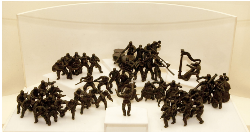
Bron en muziekstuk 6' H 80 x B 50 x D 15 cm Coll. Federaal Parlement, Senaat

De massa figuren in het Orkest lijken haast getekend of geschetst te zijn. Orkest is een vroeg werk van Willy Peeters. Het is één van zijn eerste werken in brons, en het eerste dat in een publieke verzameling opgenomen wordt. Zoals vermeld bij het kunstwerk Vrijheid en wet werkt de beeldhouwer vaak rond de massa en groepen. De inspanning van de groep om te streven naar een gemeenschappelijk en moeilijk te bereiken doel komt ook hier tot uiting in de vorm van een orkest.