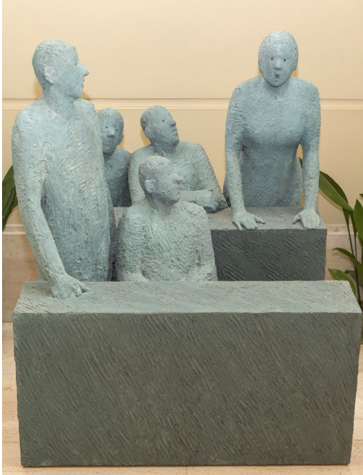
Polyester H 160 x B 91 x D 105 Coll. Federaal Parlement, Senaat