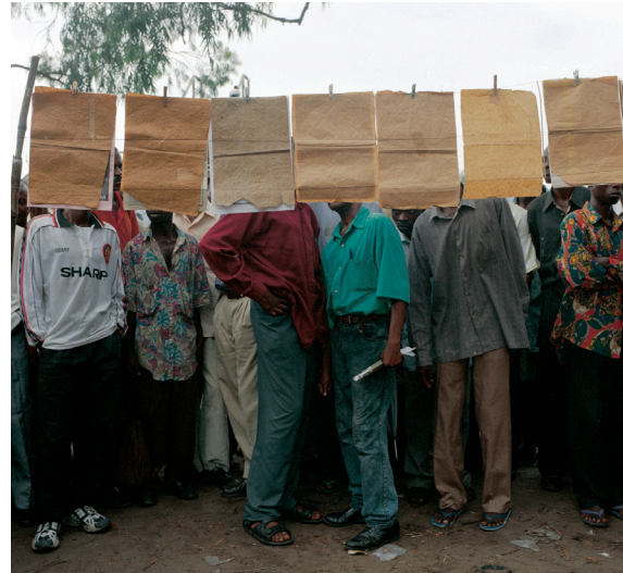
Fotografie H 70 x B 70 cm

In zijn boek Kinshasa, verhalen van de onzichtbare stad belicht de antropoloog Filip De Boeck een fenomeen dat ook geïllustreerd wordt door de foto Parlementaires debout van Marie-Françoise Plissart. Onder de bomen langs de hoofdwegen en boulevards van Kinshasa zijn allerlei activiteiten te vinden. Geen van deze activiteiten wordt in een gebouw uitgevoerd. Het gaat niet om het gebouw, maar om het concept. Het enige dat nodig is, is een touw dat tussen twee bomen wordt gespannen om de kranten van de dag op te hangen en een platform te creëren voor de "parlementariërs".