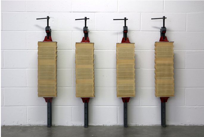
12 volumes van het Belgisch Staatsblad geknipt en geperst tussen 4 metalen klemmen 4 x H 147 x B 24 x D 16 cm Coll. Provincie Henegouwen – Bruikleen BPS22, Charleroi

Een volledige jaargang van de juridische publicatie Het Belgisch Staatsblad wordt gecompriëerd en geklemd tussen de kaken van vier metalen klemmen in De Vier Seizoenen van het Belgisch Staatsblad . De wetgeving verdwijnt. De wet verstikt. De schroef klemt. De menselijke arbeid wordt gecompriëerd. Het juridisch jargon wordt onleesbaar. De administratieve autoriteit wordt gewichtig en een zwaargewicht. Het intellectuele begrip wordt omgezet in zintuigelijk gewicht. De overvloed aan woorden verdwijnt in vorm, gewicht en materiaal. Het staatsblad wordt in deze vorm een sculptuur.