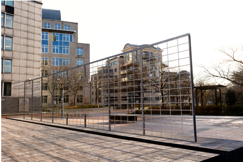
Aluminum, beton H 350 x B 220 x D 600 cm Coll. The Artists' Parliament

Dit werk, dat tegelkert.d alledaags en b.zonder is, heeft de vorm van een lang raster op een ondergrond van betonblokken. Deze ondergrond is volledig zilverkleurig, net als het raster, waarvan de openingen dezelfde afmetingen hebben als de betonblokken. Er zit een groot gat aan de bovenkant van dit rooster, dat erin l.kt te z.n geblazen door een sterke luchtstroom.