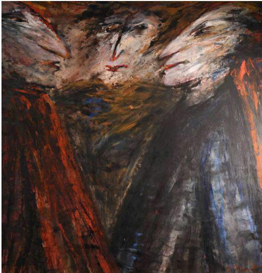
Acrylverf op papier gemaroufleerd op doek H 145 X B 140 cm Coll. BNP Parisbas Fortis

In De Discussie wordt de compositie ontdaan van alle overbodige details zodat de kijker zich kan concentreren op het gesprek. De nadruk wordt bewust gelegd op de gezichten van de drie personages die in een gesprek verwickeld zijn. De scène wordt versterkt door het gebruik van lichte en luminieuze kleuren voor de gezichten en donkere, aardse kleuren voor de kleding. De diagonalen geven het werk extra dramatiek.