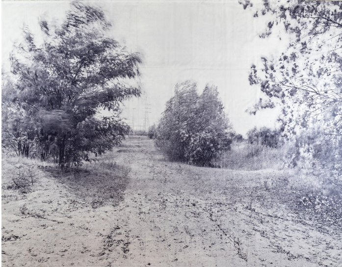
Zwart wit foto op doek H 230 cm x B 300 cm Coll. Brussels Parlement

In het begin van de jaren 1980 maakt Fastenaekens de reeks Nocturnes , verstilde nachtbeelden van stedelijke sites. De reeks is een warme, poëtische blik op wat normaal aan de aandacht ontsnapt. De nachtbeelden van verlaten grootschalige bedrijven en industriële installaties in de reeks Datar lijken vage herinneringen van een tanende industrie en diens betekenis voor de Europese cultuur. Er schuilt een sterke suggestieve kracht in de beelden, ze vertolken de "stille welsprekendheid" van de ruïnes. In zijn reeks Site zet de fotograaf zijn werk over Brussel verder, met zijn zwart wit foto's over de ontwikkeling van het stedelijk weefsel. In een recentere reeks over Brussel "herfotografeert" hij een aantal oude postkaarten. De fotograaf kruipt bijna letterlijk in de huid van de eerdere fotograaf. De vergelijking tussen oud en nieuw beeld laat dan niet zozeer zien wat er precies is veranderd, maar brengt de culturele verschuivingen aan het licht die de afgelopen eeuw in het kijken naar de stad zijn opgetreden.