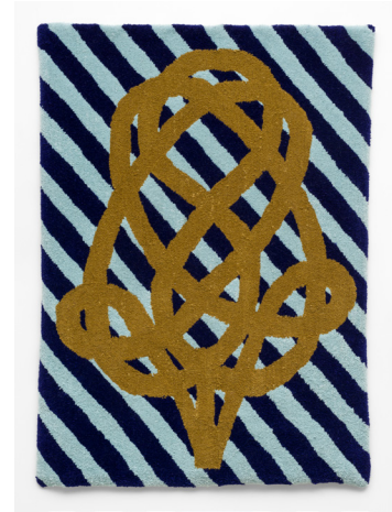
Handgetufte wollen tapijten 3 x H 180 x B 130 cm Coll. Vlaams Parlement

De drie handgetufte Carpet Beater Carpets ontwerpt Kato Six specifiek voor het Vlaams Parlement. De tapijten komen tot stand na een intensief arbeidsproces, die de nodige moeite en kunde vergen. Dit proces staat als metafoor voor het democratisch proces in een parlement. In de drie wandtapijten verschijnt in de compositie van kleurrijke lijnen en patronen een mattenklopper. Deze moeizaam in elkaar geweven mattenklopper staat symbool voor het onzichtbare en ingewikkelde werk. Denk hierbij aan het vormen van een parlement, de lange weg van debatten, discussies, coalities, van waaruit éénheid in meerderheid groeit en er uiteindelijk beslissingen komen en wetten worden gestemd. De mattenklopper is tevens een stevig en uiterst effectief onderhoudsinstrument. Ook dit geldt voor een parlement: het fungeert als een slagkrachtig instrument, de instelling als een efficiënt maatschappelijk werktuig. En als het niet langer slagkrachtig is, dient het stof er te worden uitgeklopt, zoals door een mattenklopper. Een mattenklopper