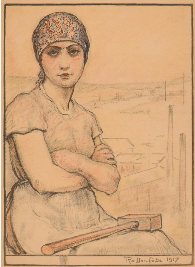
Houstkool en pastel op papier H 27 x B 20 cm Coll. Parlement van Wallonië, Namen

La hiercheuse (marteau) ( De mijnwerkster (hamer) ), 1917